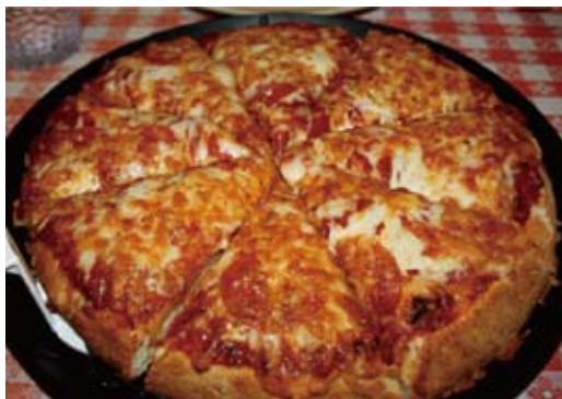
図1 ポリウムたっぷりのシカゴ・ピザ

地ともいわれる多数の近代的なビル群、底の深いフライパンで作る厚焼きジューシーなピザ「シカゴ・ピザ」(図1)が名物です。最近ではオバマ大統領の夫人ミシェルさんの生まれ故郷、そして大統領になるまで法律事務所を構えていた町として脚光をあびています。